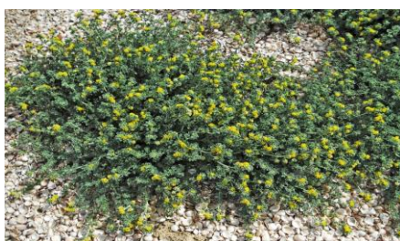
לוטוס מכסיף-Lotus creticus

להלן המינים הנמצאים בגבעת גן המקלט בפארק (המידע הבוטני לקוח מאתר "צמח השדה"):