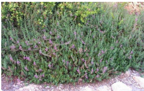
געדה מפושקת - Teucrium divaricatum

ברפואה העממית הוא משמש נגד כאב ראש, כאבי פרקים, כאב-בטן והרעלות. הוא מסייע גם לחיזוק שורשי השיער ולשיפור הראייה. כיום שיח אברהם נחשב הצמח המשמעותי ביותר בטיפול בהפרעות הורמונליות בנשים. החומר העיקרי בצמח הוא אלקלואיד בשם ויטיסין. כמו כן הצמח מכיל פלבנואידים, חומרים אנטי דלקתיים ונוגדי חמצון וכן חומר הנקרא אירידיודים גליקוזידים עם טעם מריר המשכך כאב ונוגד דלקת.