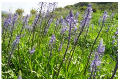
בן-חצב יקינתוני - Scilla hyacinthoides

מרווה משולשת היא מלכת צמחי הרפואה העממית. מייחסים לה תכונות רבות: ריפוי פגעים בדרכי הנשימה; ריפוי פגעים בדרכי העיכול, החל מהחך והחניכיים ועד לפי הטבעת; סיוע בריפוי פצעים בעור ופטריות בין אצבעות הרגליים; הקלה על לחץ דם גבוה, חוסר תיאבון, כאב-ראש, רעידות בידיים, כאבי פרקים, כאבי אוזניים. מומלץ בעיקר להשתמש בה כחליטה.