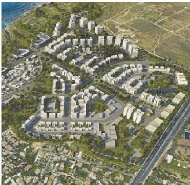
הדמיה של תוכנית אפולוניה בהרצליה