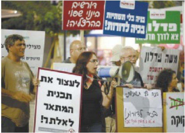
הפגנה נגד תוכניות הבנייה בהרצליה, בספטמבר

כונים הסביבתיים מחומרים מסוכ"נים הנמצאים בארמה. הוועדה המקומית הרצליה כת"בה בהחלטתה כי תבקש למשוך גם את התוכניות לחוף התכלת, שבה תוכננה בנייה של 11.5 אלף יחידות דיוור בנוסף לשטחי מסחר ומלונות, ואת תוכנית מת"ש, שבה תוכננה בניית 2,500 יחידות דיוור במקום המכון לטיהור שפכים. לדברי העי"רייה, גם תוכניות אלו היו אמורות להתקדם במסגרת הוותמ"ל. באחרונה ביקשה מועצת העיר הרצליה להחזיר אליה את תוכנית