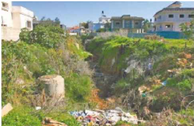
אשפה בטירה

מצבן הפיננסי של הרשויות המקומיות השתפר לעומת 2010, אך יותר משליש מהן עדיין נמצאות בגירעון תקציבי • רוב הרשויות הגדולות באזור המרכז סיימו את 2011 בעודף • 40% מהמועסקים משתכרים מתחת לשכר מינימום • יו"ר מרכז השלטון המקומי שלמה בוחבוט: "השלטון המקומי מתייעל ומנהל את תקציביו בחוכמה"