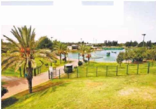
פארק ברעננה