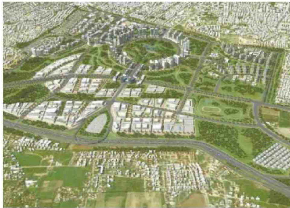
הדמיה של תוכנית קדמת השרון הדמיה: רשות מקרקעי ישראל