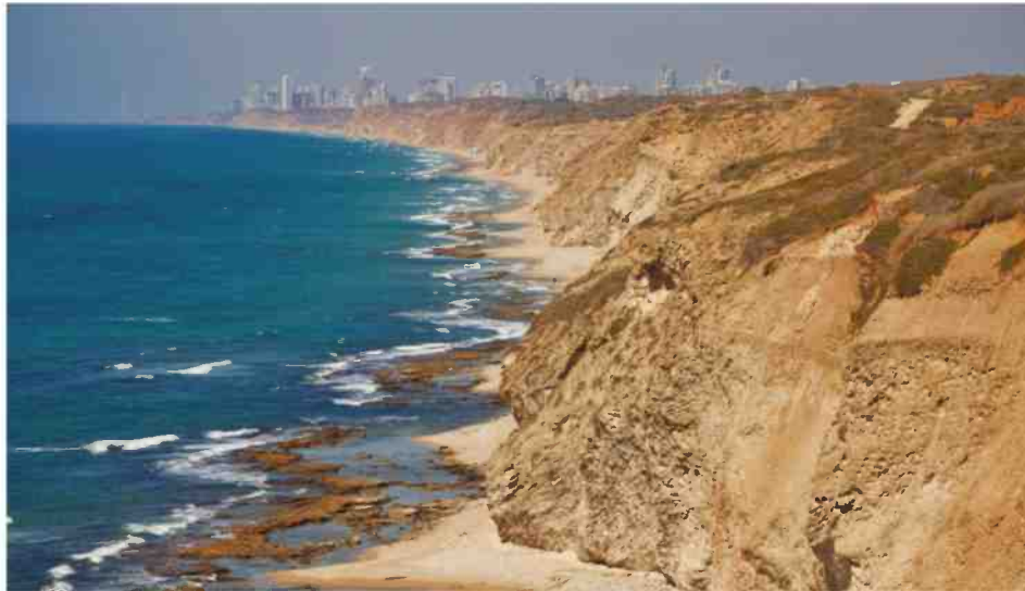
חוף אפולוניה. "מתנגדים לפגיעה בערכי טבע ומורשת"

"זה לא שלא נבנו בהרצליה שכונות חדשות, אבל העיר נמצאת על הקשקש מבחינת תשתיות מתאימות ומוסדות חינוך שאני מסוגל לספק לאלפי הילדים שייקלטו בעיר. אני נאבק עם שר החינוך על תקציבים לפתיחת כיתות נוספות"