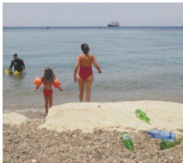
בקבוקים על שפת הים באילת, אתמול