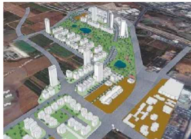
הדמיה: רשות מקרקעי ישראל

רשות מקרקעי ישראל (רמ"י) הציאה מכרז לתכנון מחודש של 350 דונם במתחם גליל ים, הסמוך למחלף הסיירה, בדרום מערב הרצליה. זאת, לאחר שבדיון שנערך לפני בחודש דחתה הוועדה המדקומית הרצליה תוכנית מפורטת שהגיש המנהל לבניית 2,700 דירות בשטח, בנימוק שהתוכנית כוללת מטלות ציבוריות רבות (עבודות פיתוח) בסך מאות מיליוני שקלים – אך לא מעגנת מקורות כספיים למימון.